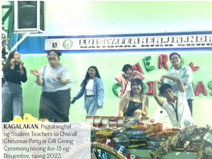
KAGALAKAN. Pagtatanghal ng Student Teachers sa Overall Christmas Party at Gift Giving Ceremony noong ika-15 ng Disyembre, taong 2023.

S a pamamahala ng mga ibang organisasyong pampaaralan, ang pangongolekta ng mga recyclable materials at iba pang kaguruan, matagumpay ang naging pagdaraos ng paaralan para sa kapaskuhan noong ika-29 ng Nobyembre hanggang ika-5 ng Disyembre, taong 2023.